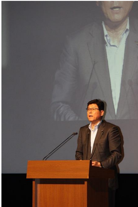
高木復興大臣の冒頭挨拶