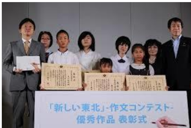
「新しい東北」作文コンテスト優秀作品表彰式