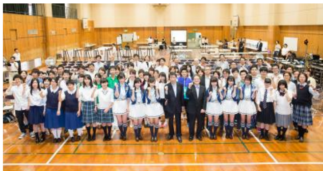
当日参加者との集合写真

「これからも震災復興のために、私にできることを続けていきたいです。」とご自身の想いを語ってくれました。